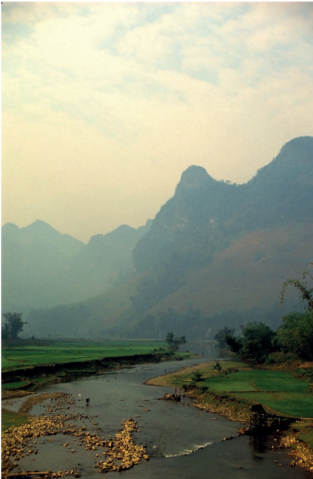
Voldsomme kontraster: Dagliglivet for nord-vietnameserne har lite til felles med resten av lavlandet. Overalt står natur- og kultur attraksjonene i kø.