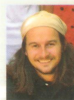
Simen Julner Babel Guesthouse Siem Reap, Kambodsja www.babelsiemreap.hostel.com

– Det er morsomt å drive med noe eget i et så fremmed land. Sånn sett blir det en livsstil, og mange drømmer nok om noe tilsvarende. Grip den drømmen, anbefaler paret. ■