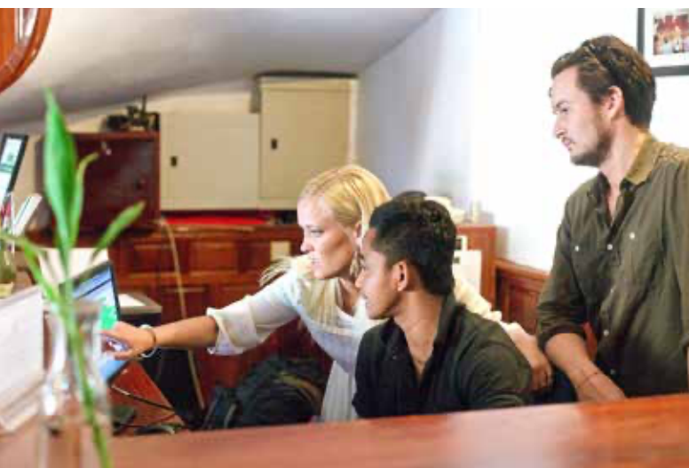
Nytt datasystem i resepsjonen; her gjelder det å øve til det sitter.