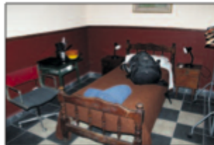
Reiseretning. Under et studioscaphot i Argentina, var det en overmaskin med tanke på de nye spanske bokstrolkene. De var det bedre i Kambodja.