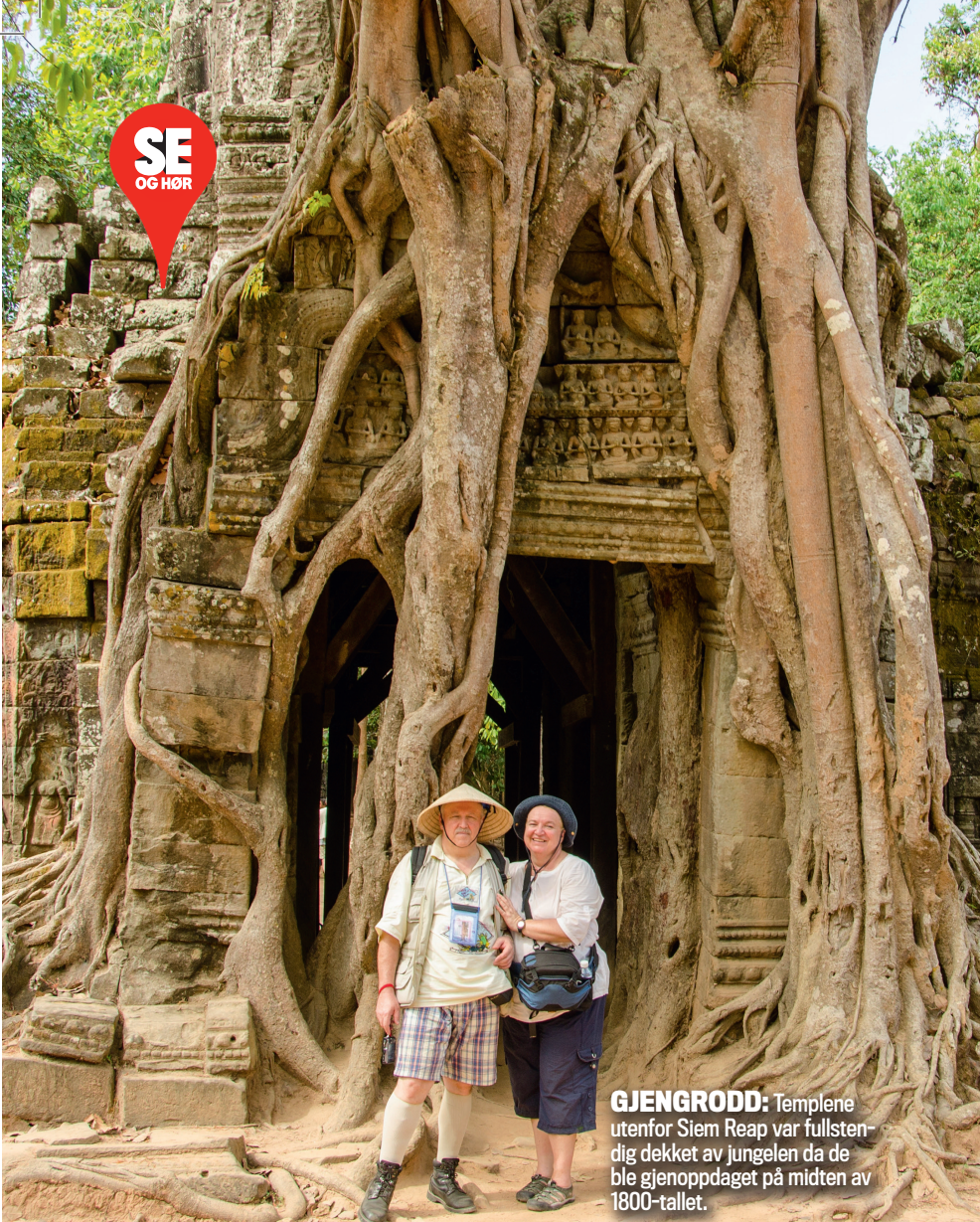
GJENGRØDD: Templene utenfor Siem Reap var fullstendig dekket av jungelen da de ble gjenoppgdaget på midten av 1800-tallet.

den. Kambodsjas korte kystlinje fyller alle kriterier. Etter noen timer med buss eller bil sørover fra Phnom Penh, kommer du til landets riviera. Sihanoukville er en badeby med det beste og verste fra turismen. Noen grelle hotell og overbefolkede strender, men også ren og vakker strandidyll. Det gjelder å velge strand med omhu, og Otres Beach er et klokt valg for den som ikke vil ha for mye kjas og mas.