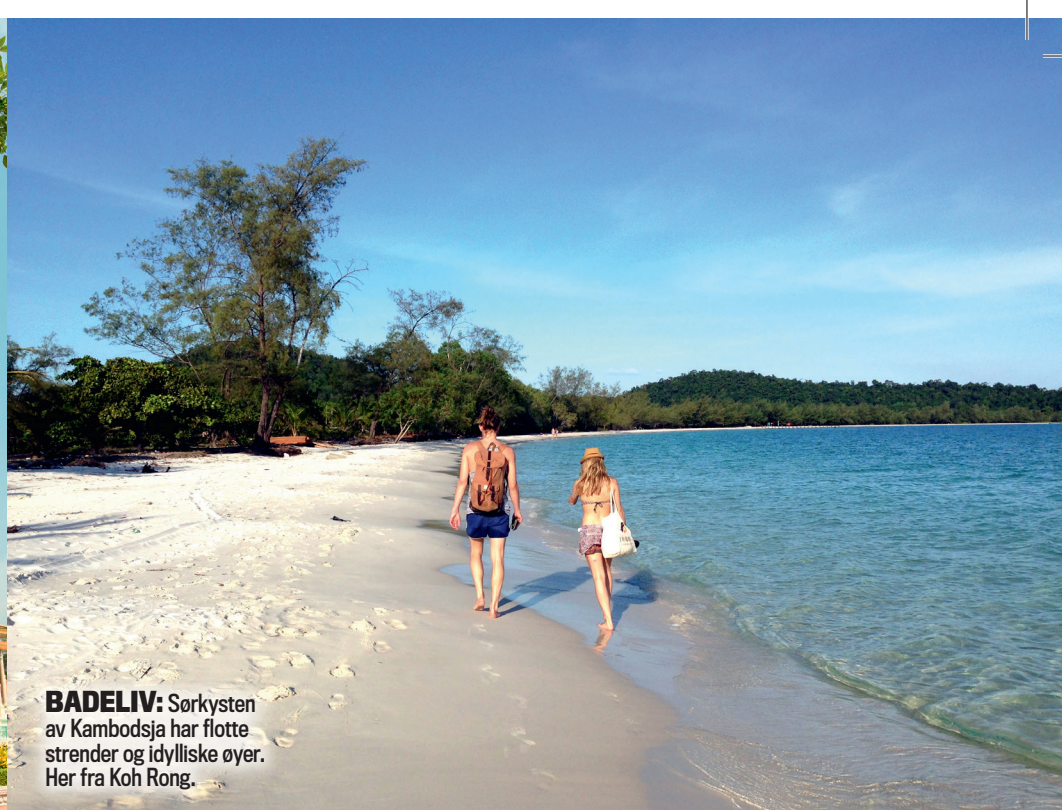
BADELIV: Sørkysten av Kambodsja har flotte strender og idylliske øyer. Her fra Koh Rong.