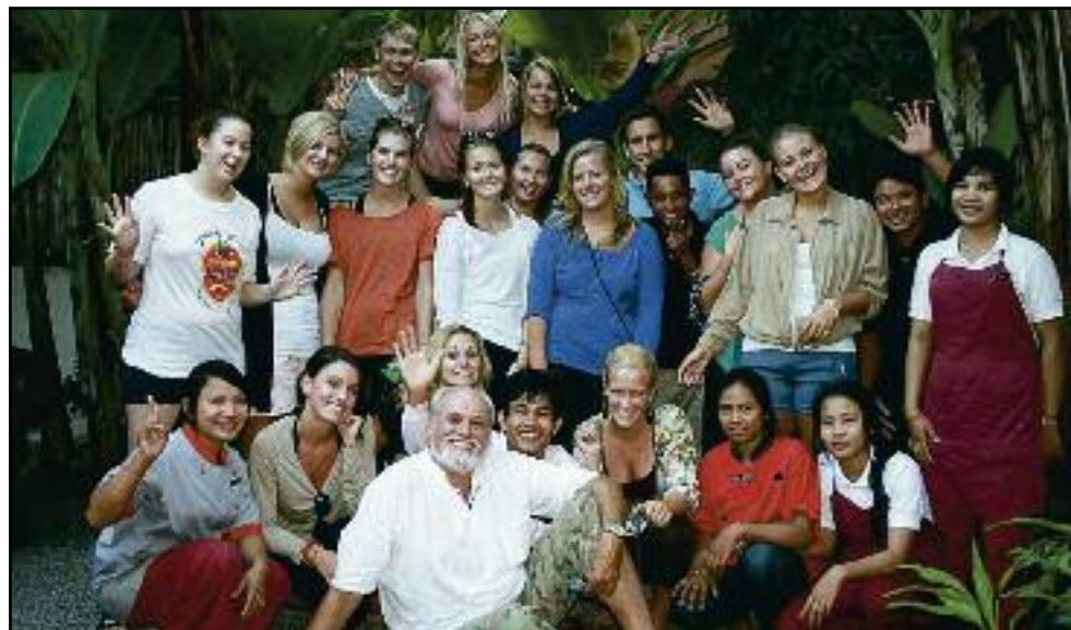
Skolegjengen. Her er fjorårets studenter fra Norge samlet til fellesbilde inne på Babel gjestehus.