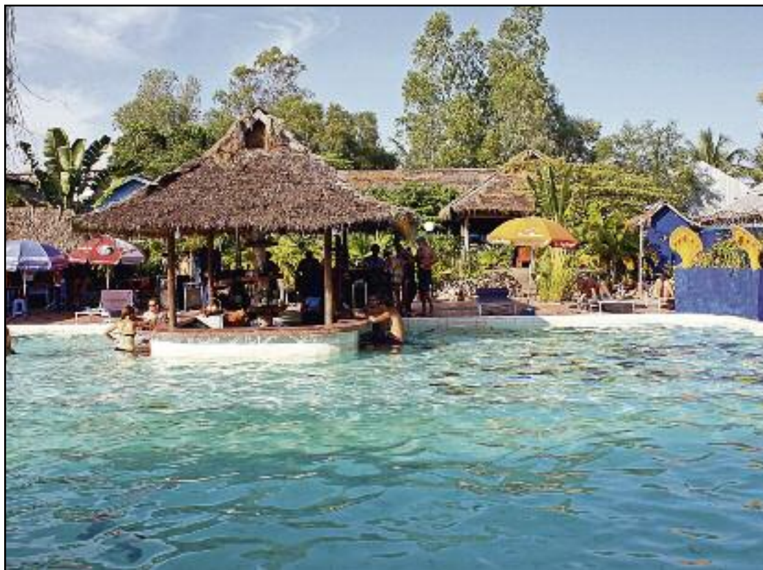
Studiestedet. Det er andre forhold på skolen i Kambodsja enn i Norge. Her ser du bilde fra skolegården.

Tre måneder med spennende studier i Kambodsja venter nå 11 elever fra Midt-Troms.