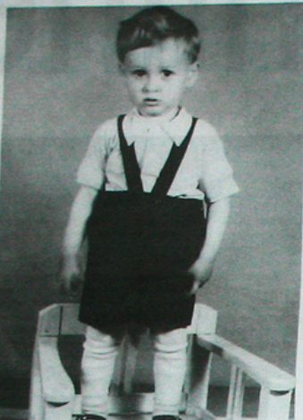
GULLGUTTEN: En formask på prekestolen? Tidlig krakesom god prest skal bli...