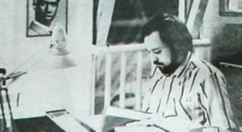
UNGDOMMENS MANN: Prestens popularitet hos ungdommen har vært upåklagelig.