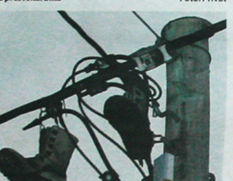
UTGÅTTE STØVLER: Familien Solhaug har gitt begrepet «støpke» nytt innhold.