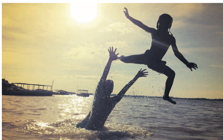
BADEMULIGHETER: Selv om Siem Reap ligger et stykke fra havet, er det bademuligheter nok.