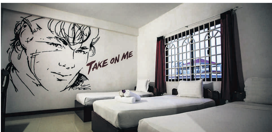
SÆREGNE ROM: Alle rommene på gjesthuset er musikalsk inspirert. Her fra AHA-rommet.