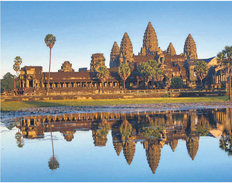
ANGKOR WAT: Tempelet er et fantastisk byggverk som står som et symbol på Khmer-kulturen.