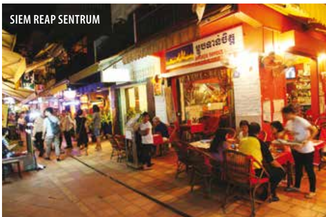
SIEM REAP SENTRUM

SE: Angkor Wat, selvfølgelig! Men utenfor turiststrømmen. Vi har en hemmelig perle hvor vi anbefaler våre gjester å ta med litt godt drikke og en piknikboks. Så kan du nyte solnedgangen ute i naturen, ved et utrolig sjarmerende, lite tempel som de får helt for seg selv. Tuktuken stopper ved South Gate av Angkor Thom, og så spaserer du en halvtime langs vannet (vollgraven rundt Angkor Thom) til et magisk lite tempel, uten andre turister. Du er i ett med naturen, fantastiske jungellyder, kambodsjanere sitter fredelig og fisker, kuer spaserer langs vannet... Ellers er landminemuseet ( www.cambodialandminemuseum.org ) i Angkor-området et tankevekkende møte med den nyere historien.